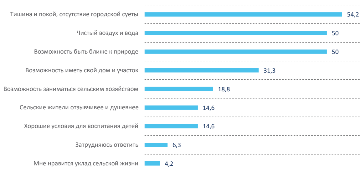
Рис. 2. Распределение ответов молодежи Вологодской области на вопрос «Что Вас привлекает в жизни в сельской местности?» в 2017 году, %