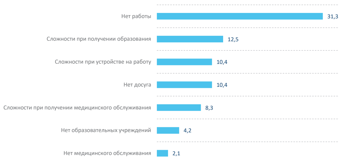
Рис. 1. Распределение ответов молодежи Вологодской области на вопрос «По какой причине Вы хотите сменить место жительства?» в 2017 году, %

сельской экономики. Это развитие несельскохозяйственного производства (лесозаготовки, сбор грибов, ягод), туризм, а также превращение ряда деревень, в которых проживают преимущественно пенсионеры, в аналог загородных домов для престарелых. Помимо этого, растет количество деревень, постепенно превращающихся в зоны рекреационного отдыха горожан (Подмосковье, Ленинградская, Тверская области, Юг России, Крым). Некоторые села, особенно те, которые расположены у оживленных трасс, выживают за счет торговли [20].