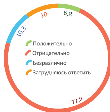
Данные Вологодского научного центра РАН (по Вологодской области)