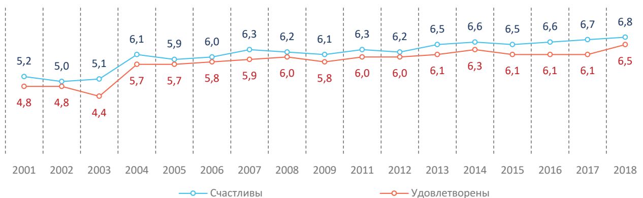
Рис. 3. Распределение ответов на вопрос «Оцените, пожалуйста, насколько Вы счастливы и удовлетворены сегодня своей жизнью?», средний балл по 10-балльной шкале