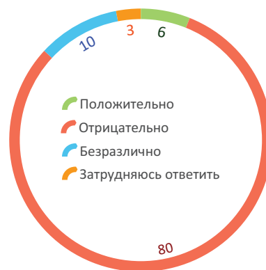
Данные Фонда «Общественное мнение» (в целом по России)*

Психологическое самочувствие жителей региона формировалось преимущественно на фоне вышеуказанных событий. По сравнению с 2017 годом структура наиболее актуальных проблем для населения региона существенно не изменилась. Как и прежде, самыми острыми проблемами для России люди